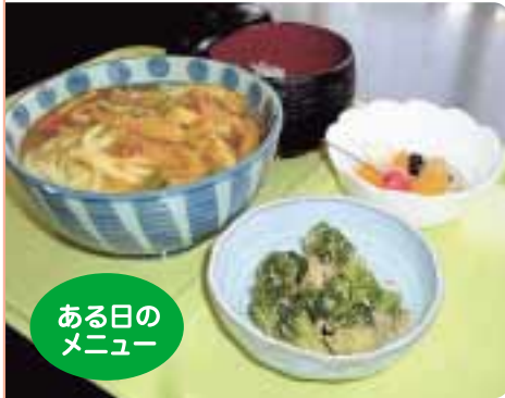
ある日の メニュー